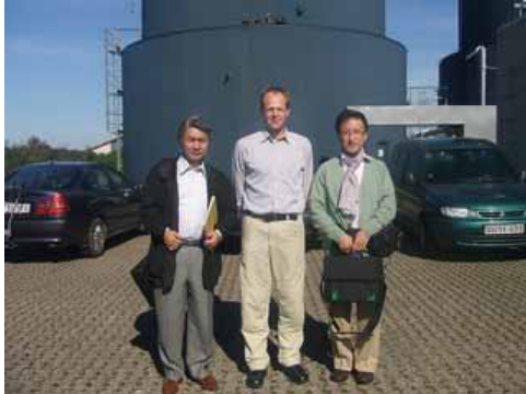
バイオガスプラントの前にて

http://blog.goo.ne.jp/mr-sakugen 是非検索下さい。