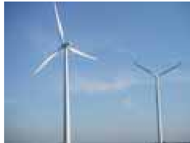
風力発電の風車(デンマーク)